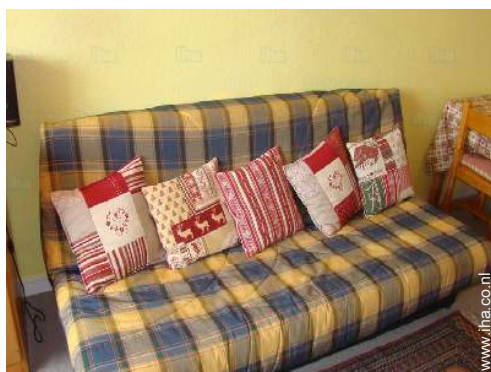
slaapbank(en) 2 pers