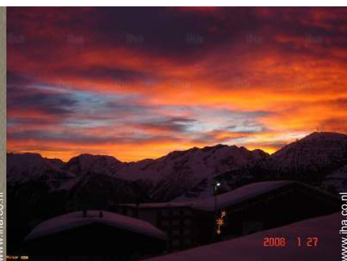
uitzicht op de bergen