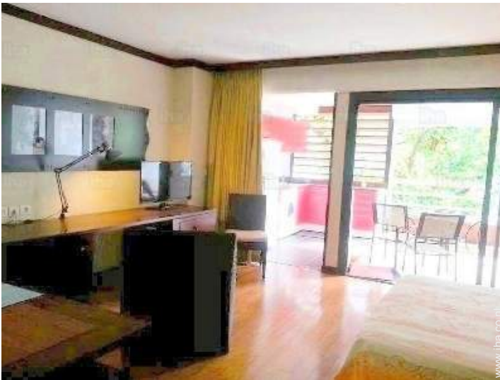
Ter beschikking staande voorzieningen