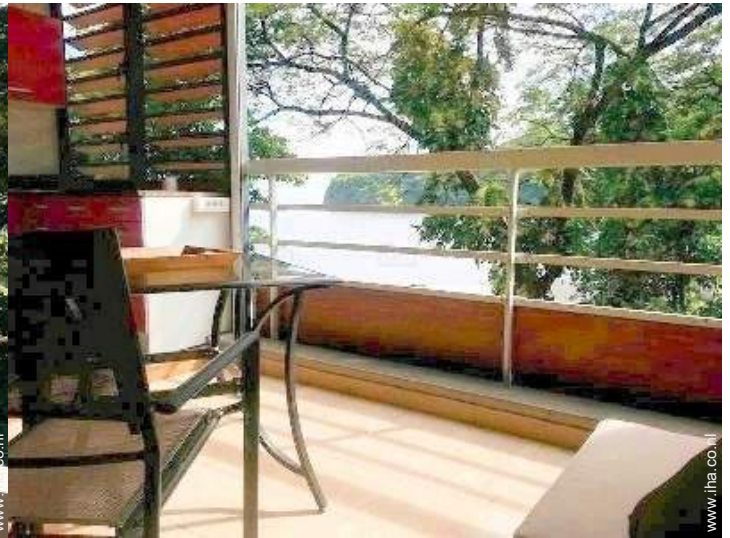
uitzicht vanuit het appartement