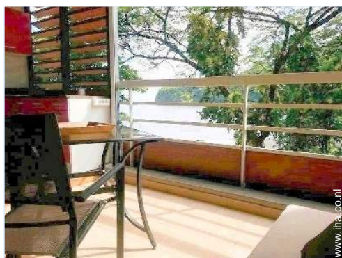
uitzicht vanuit het appartement

Voordelen : Directe toegang tot het strand