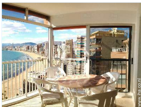
uitzicht vanuit het appartement