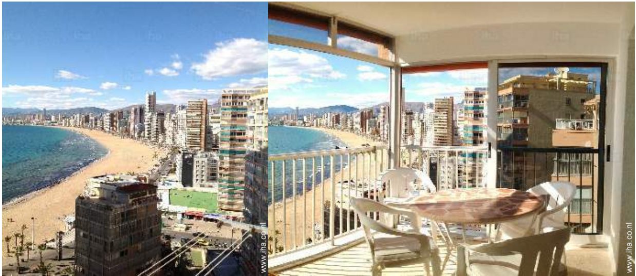
uitzicht vanuit het appartement