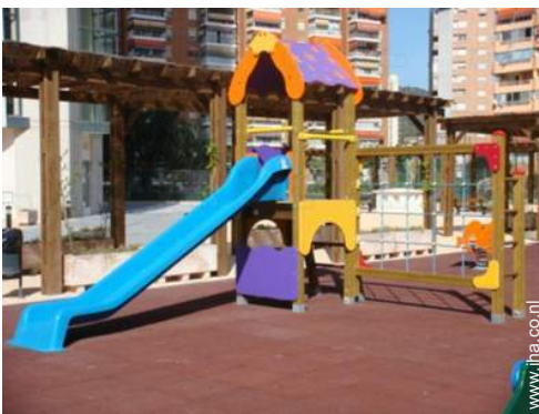
park en tuin