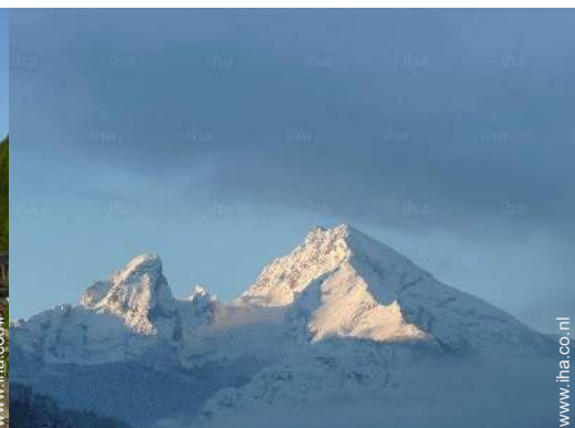
uitzicht op de bergen