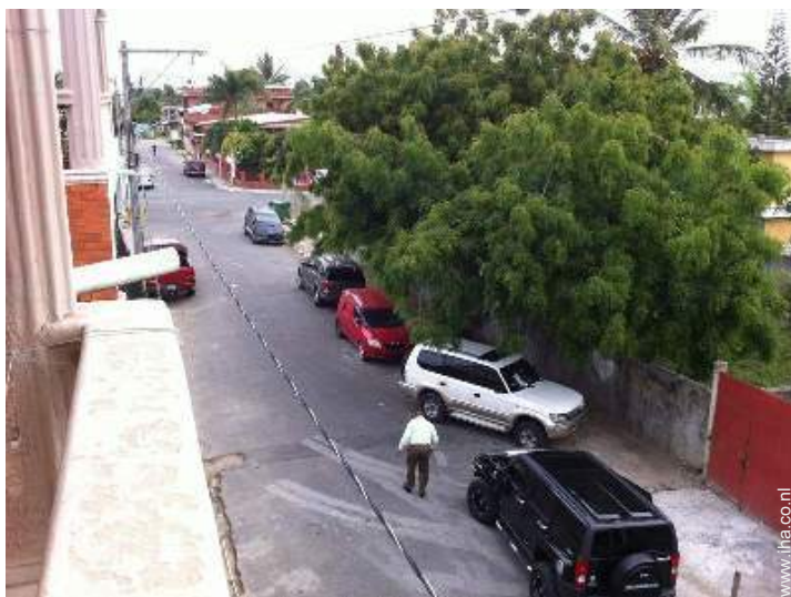
uitzicht op straat/laan