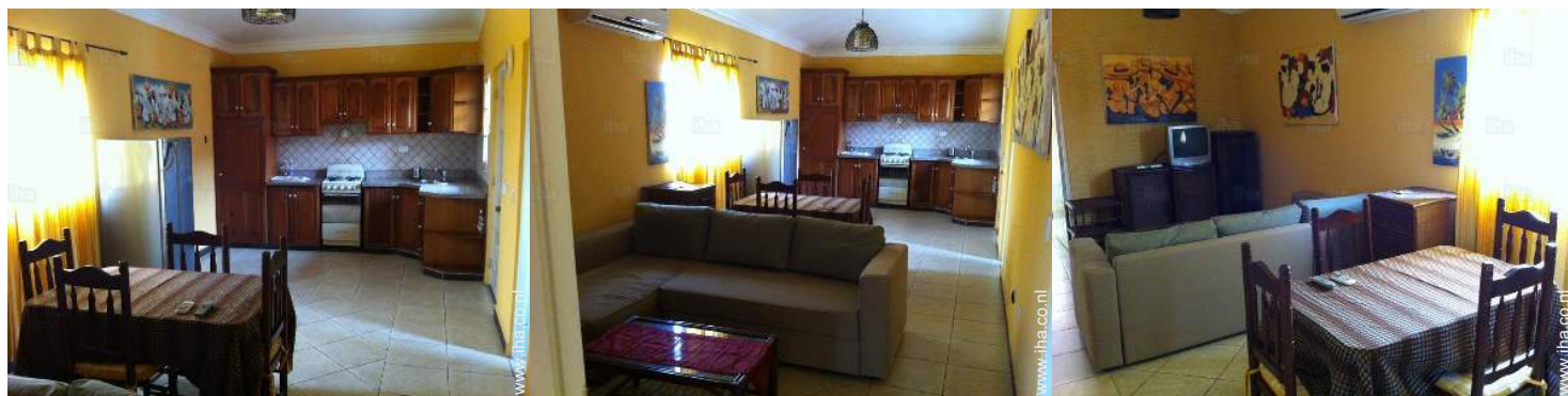
uitzicht vanuit de eetkamer