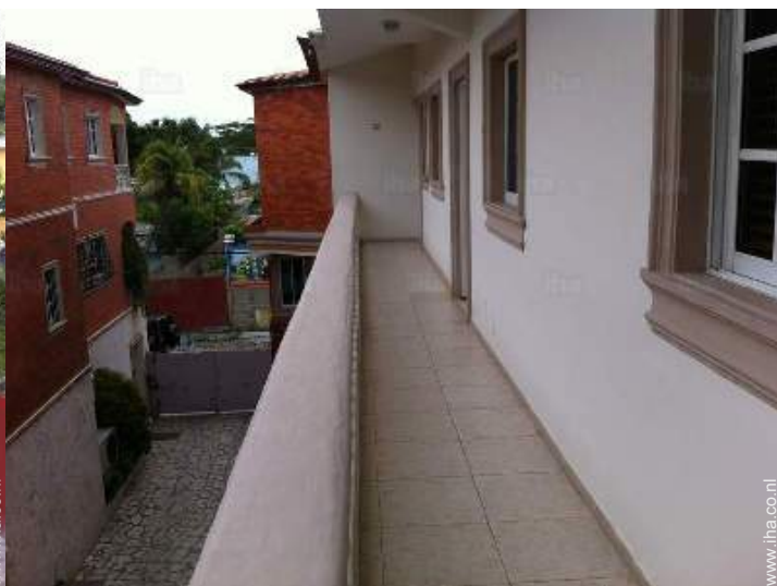
uitzicht vanaf de veranda