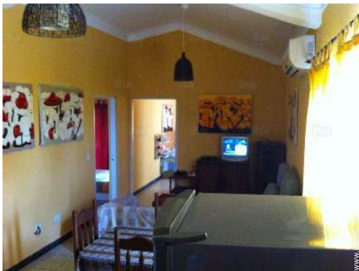
uitzicht vanuit de eetkamer