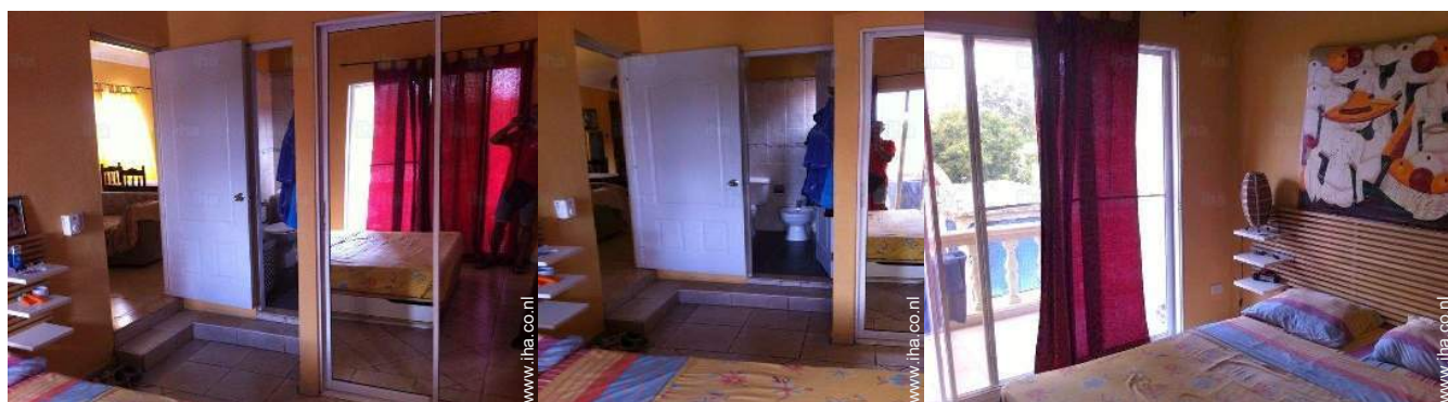
uitzicht vanuit de kamer