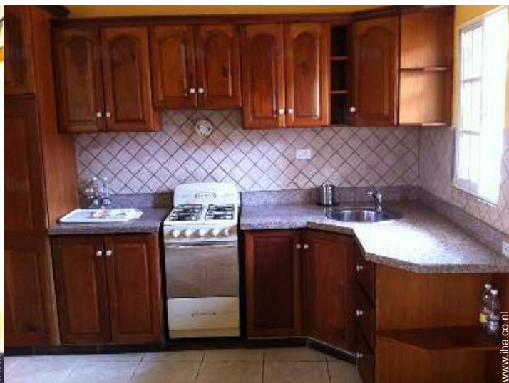
grote open keuken