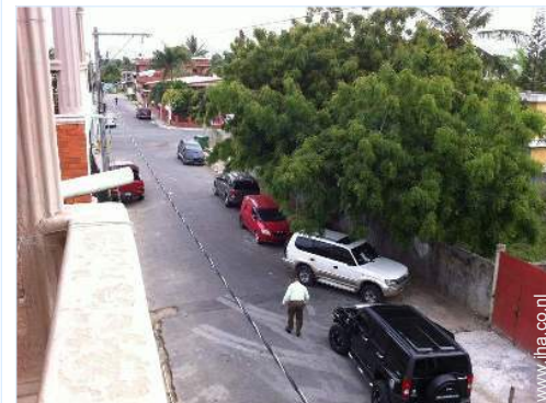
uitzicht op straat/laan