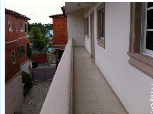
uitzicht vanaf de veranda

Zandstrand 300m Watersportcentrum 300m Pleziervaarhaven 300m Helling voor te water laten van boten 300m