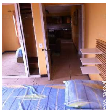
uitzicht vanuit de kamer