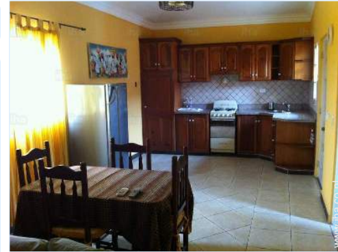
uitzicht vanuit de eetkamer