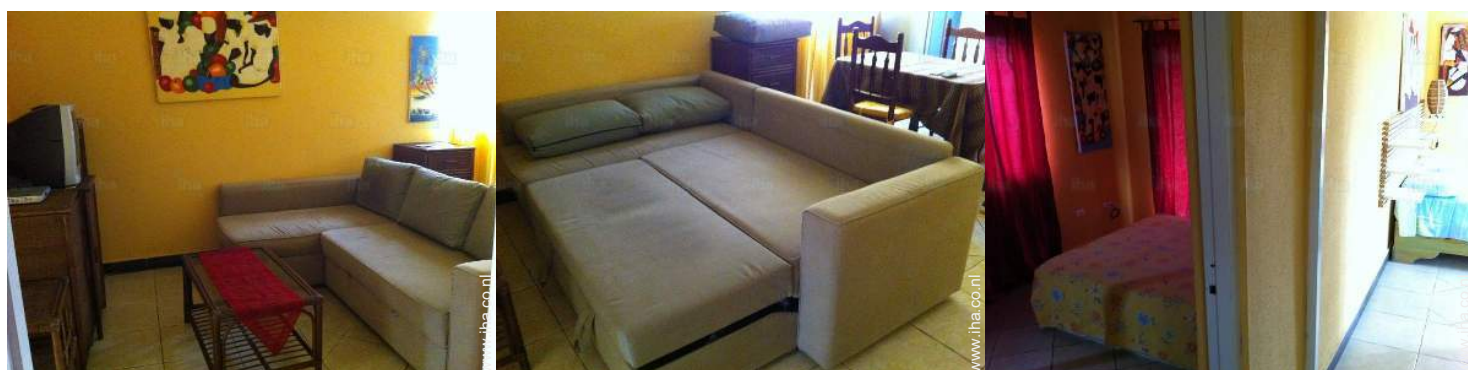
slaapbank(en) 2 pers