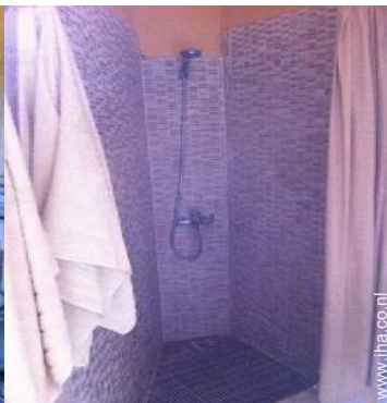
Badkamer(s) met douche