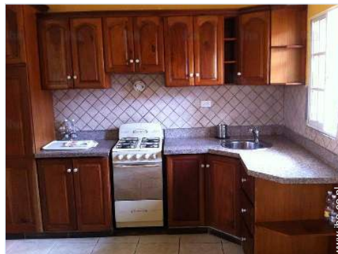
grote open keuken