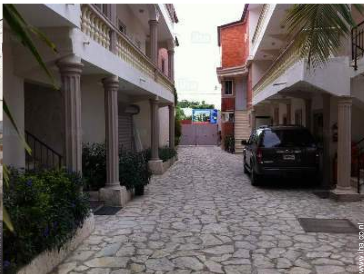
uitzicht op binnenplaats