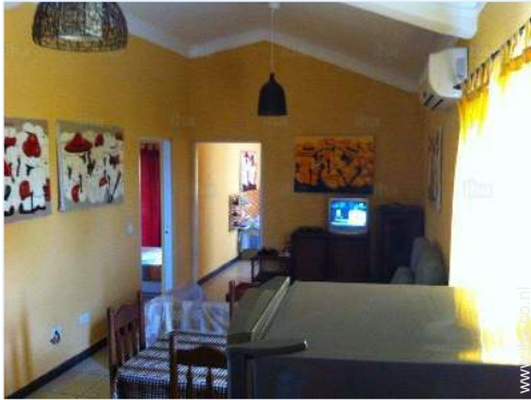
uitzicht vanuit de eetkamer