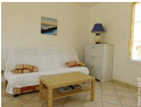
slaapbank(en) 2 pers