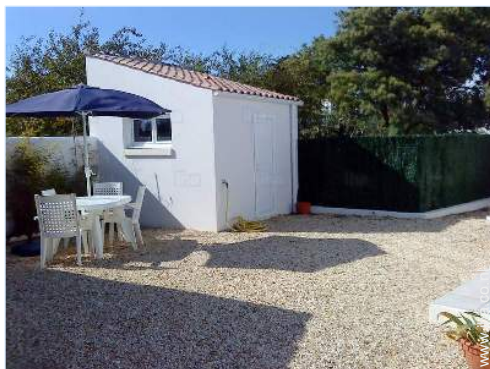
uitzicht op binnenplaats