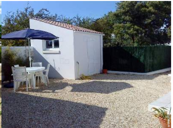
uitzicht op binnenplaats