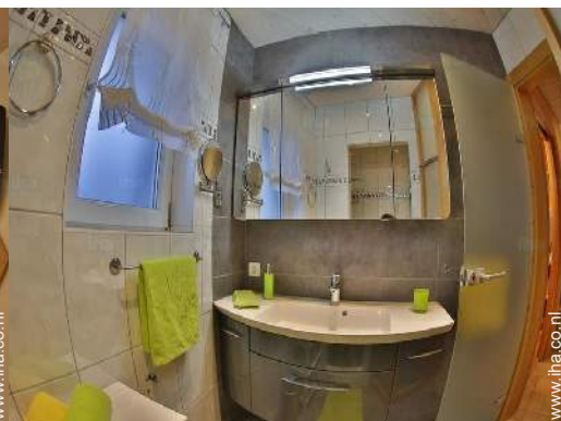
Badkamer(s) met bad