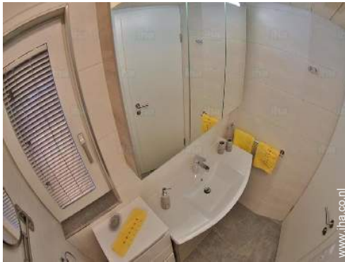
Badkamer(s) met bad