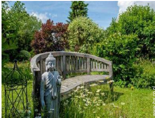
uitzicht op tuin/park