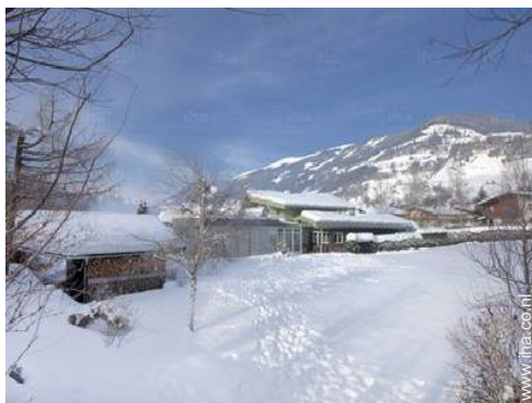
overzicht van het bezit