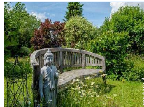
uitzicht op tuin/park