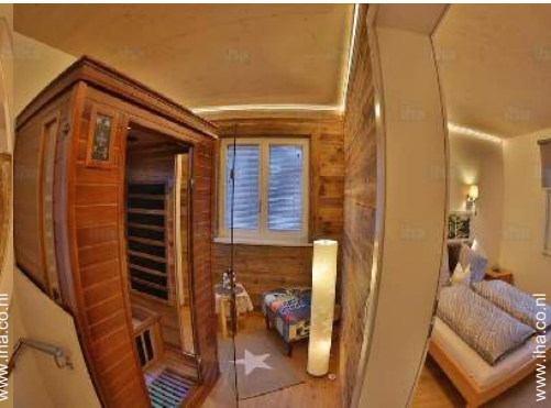
Binnenhuis inrichting en comfort