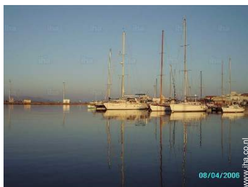
uitzicht op haven