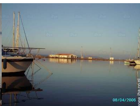
uitzicht op haven