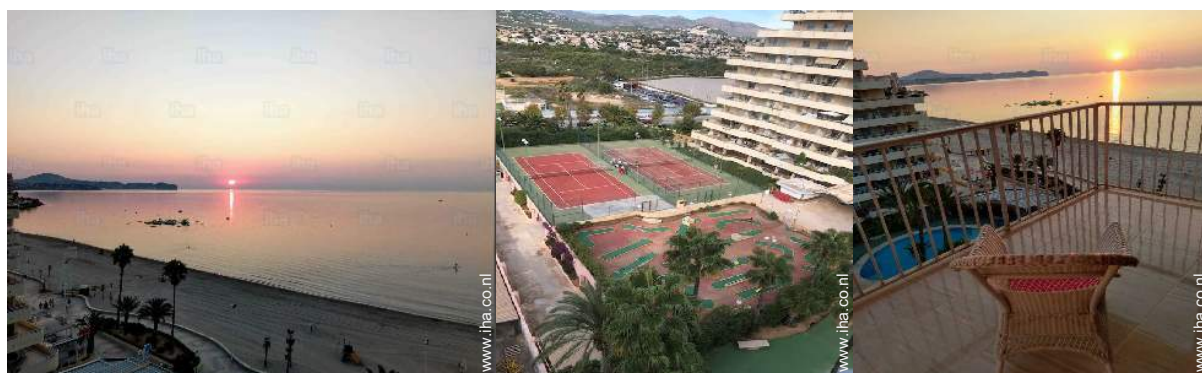
uitzicht vanaf het balkon