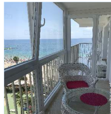
uitzicht vanaf de veranda