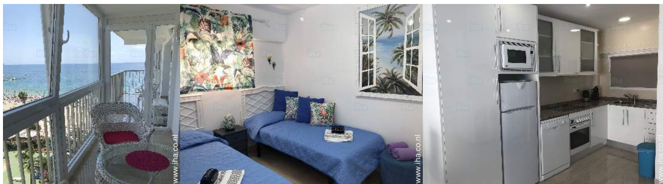
uitzicht vanaf de veranda