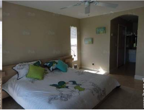
king size bed(den)