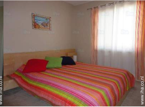
queen size bed(den)