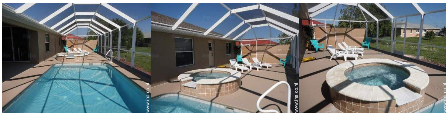
uitzicht op zwembad