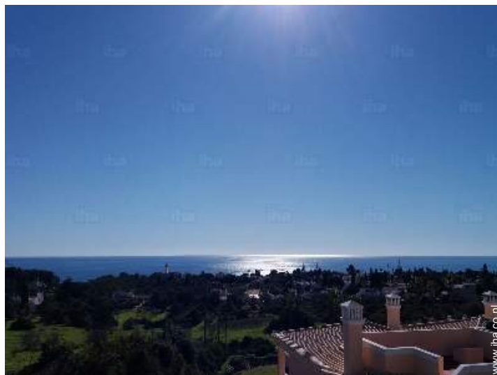
uitzicht op zee