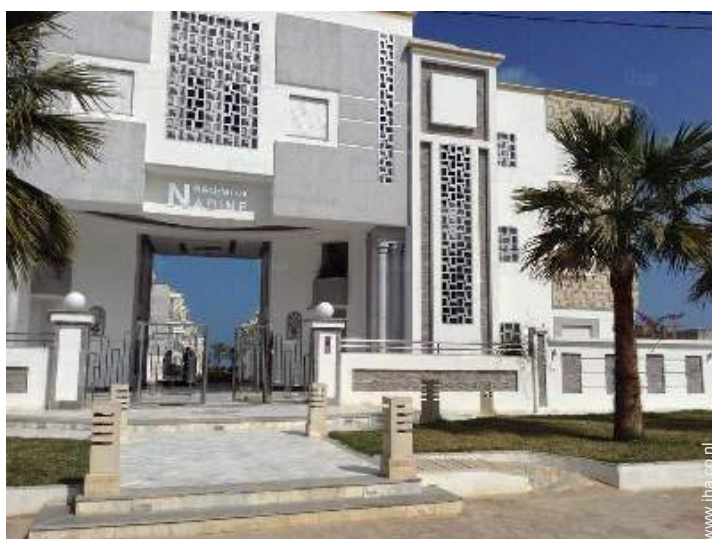
Residentie van standing