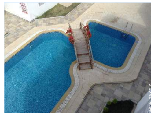
uitzicht vanaf het balkon

Tuintafel(s), 6 tuinstoel(en), serre, Openlucht douche