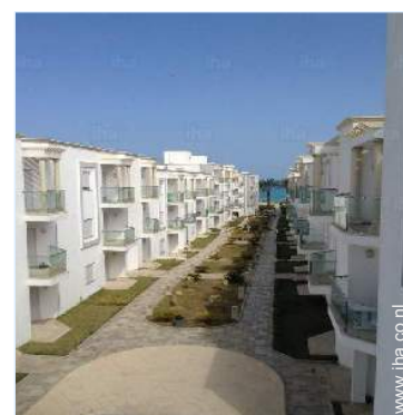
overzicht van het bezit

Dorpscentrum 1km Stadscentrum 1km Bushalte/busstation <50m Verhuur van motoren/scooters 3km Autoverhuur 5km Bootverhuur <50m Verhuur van duikmateriaal 5km Bakker 100m Kleine winkeltjes 50m Supermarkt 5km Luxe- en merk winkels 20km Kapsalon <50m Cybercafé 1km Postkantoor 1km Bank 1km Geldautomaat 1km Apotheek 1km Dokter 1km Verpleegkundige 1km Ziekenhuis 20km Consultatiebureau 1km