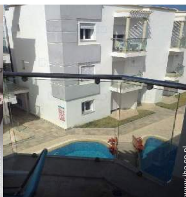
uitzicht op zwembad