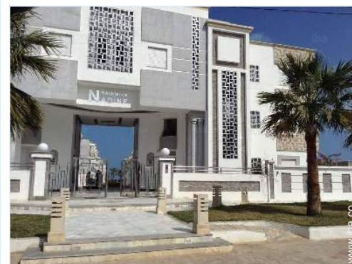
Residentie van standing