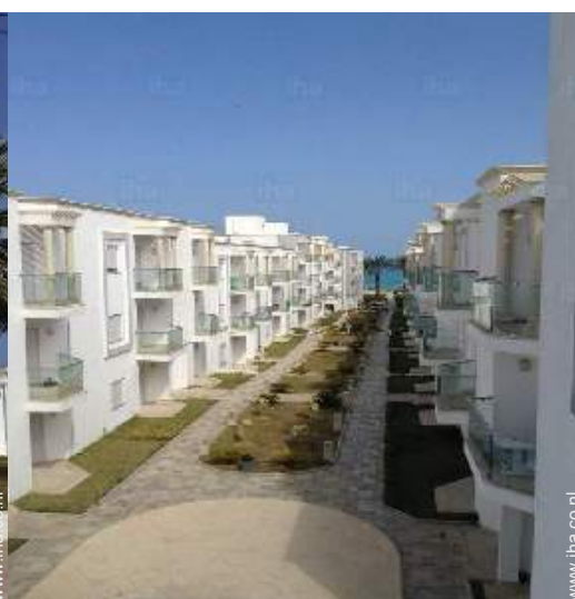
overzicht van het bezit