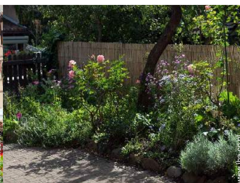
uitzicht vanuit de tuin/park