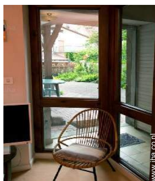
uitzicht vanuit de zitzkamer