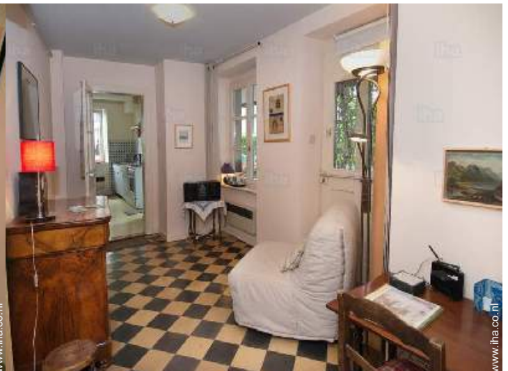
uitzicht vanuit de zitkamer