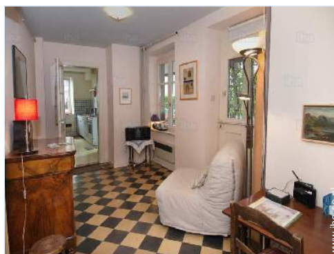
uitzicht vanuit de zitkamer