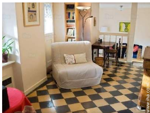
slaapbank(en) 1 pers