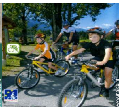
zomeractiviteiten in de omgeving