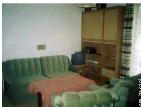
uitzicht vanuit de woonkamer