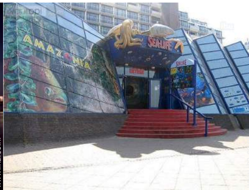
Attracties en ontspanning