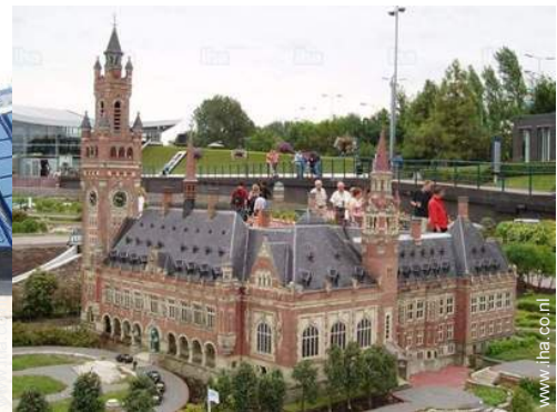
vrijetijds besteding in de nabijheid