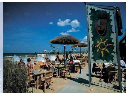
strandrecreatie in de buurt