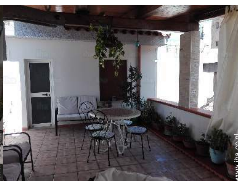
uitzicht vanaf dakterras