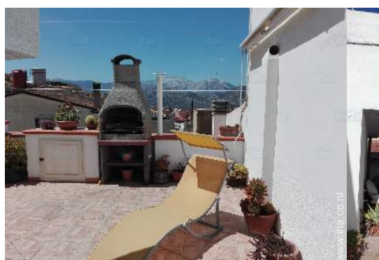
uitzicht vanaf het terras