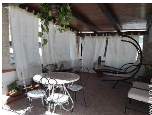
uitzicht vanaf het terras