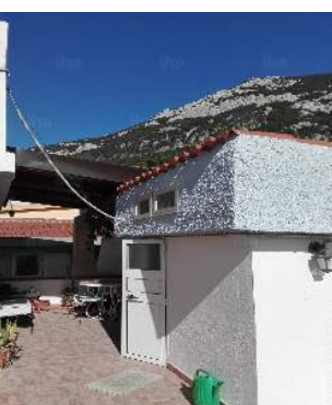
uitzicht vanaf dakterras