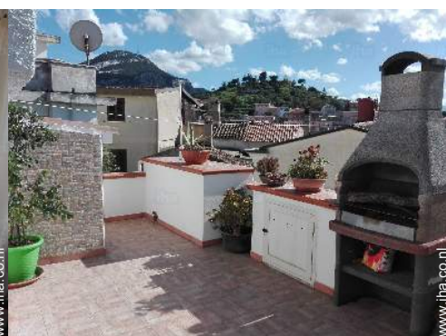
uitzicht vanaf het terras