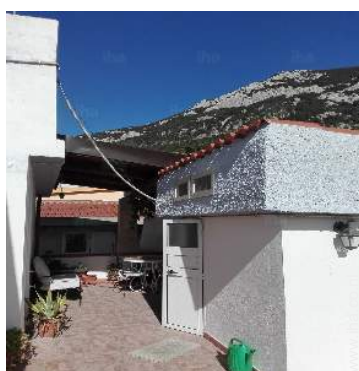
uitzicht vanaf dakterras