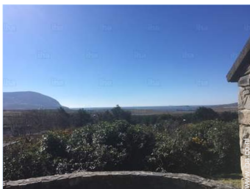
uitzicht vanaf de patio

Niet overdekte parkeerplaats : 4 op het terrein.