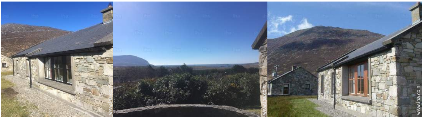
uitzicht vanaf de patio