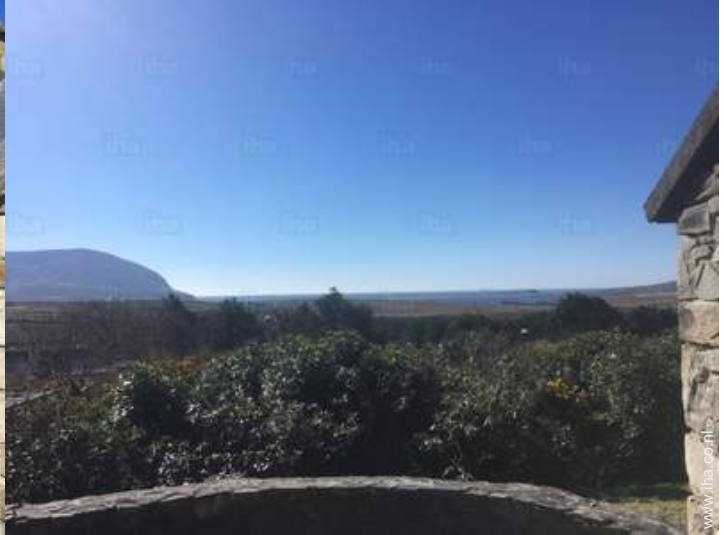
uitzicht vanaf de patio