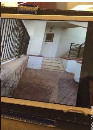
overzicht van het bezit