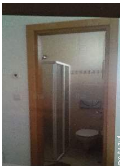
Badkamer(s) met douche