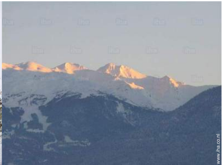
uitzicht vanaf het terras