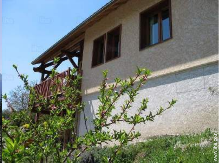
uitzicht vanuit de tuin/park