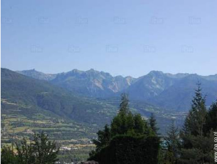
uitzicht vanuit het huis