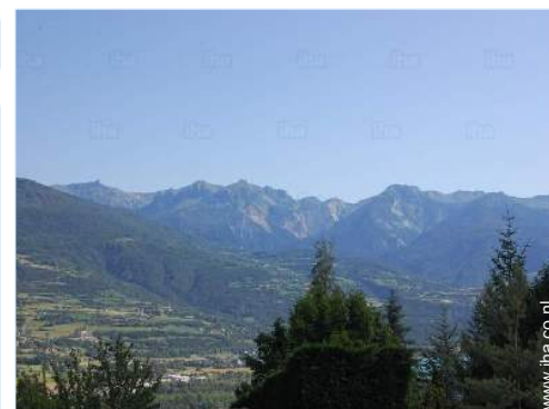
uitzicht vanuit het huis