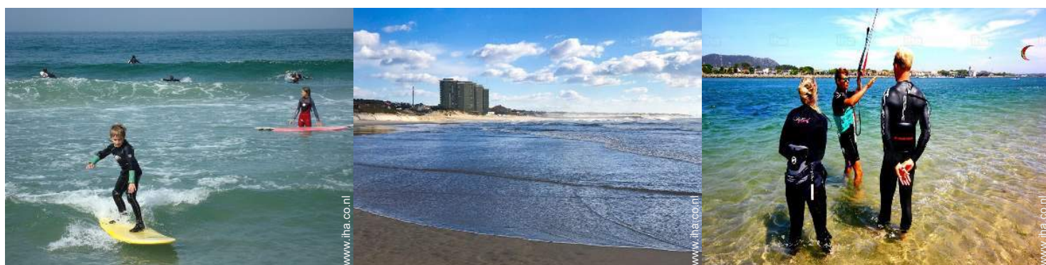
watersportactiviteiten in de omgeving