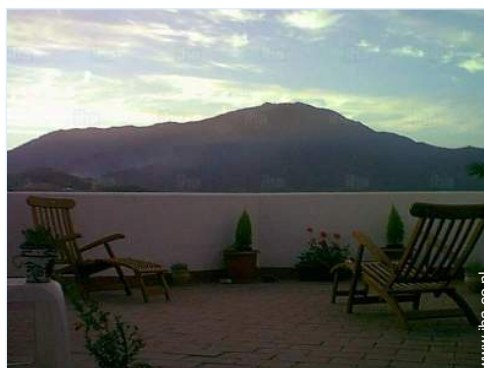
uitzicht vanaf het terras