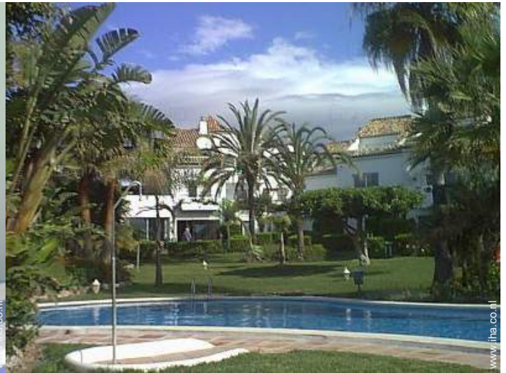
uitzicht vanuit de tuin/park