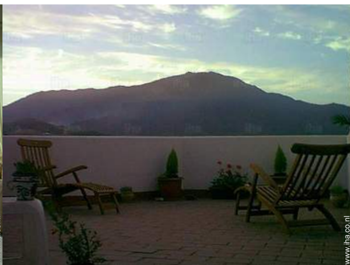
uitzicht vanaf het terras