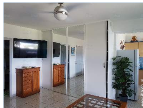
uitzicht vanuit de woonkamer