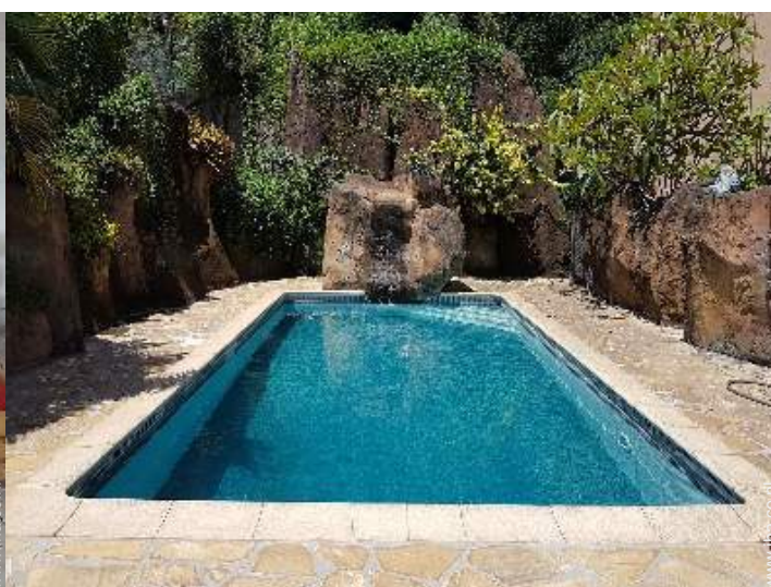
zwembad in de residentie