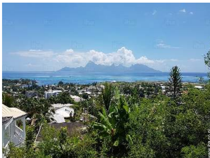
uitzicht vanuit het zwembad