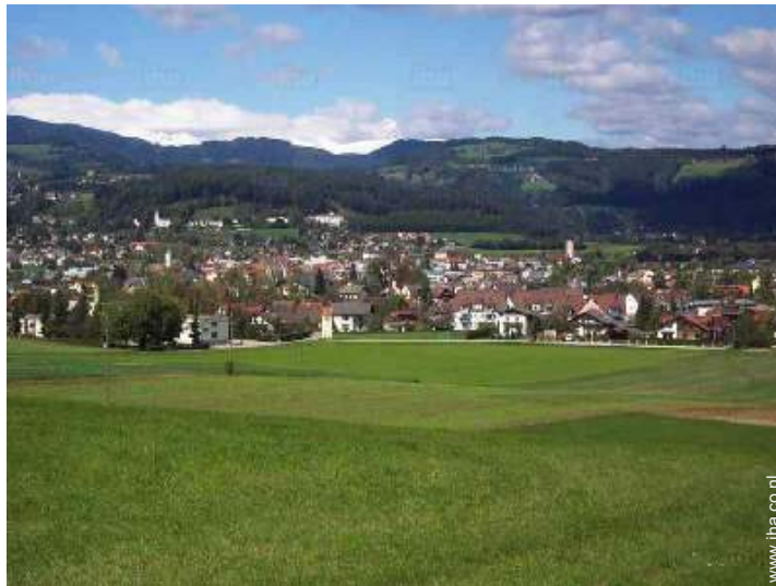
uitzicht op het platteland