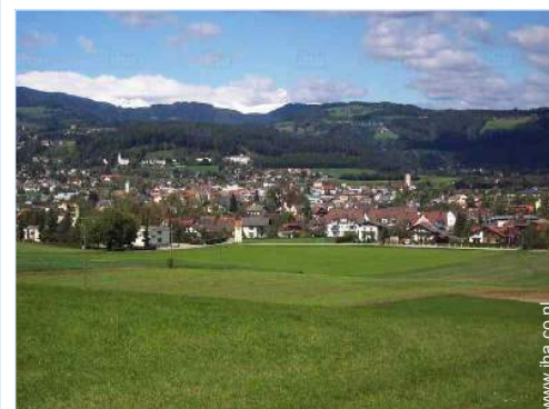
uitzicht op het platteland