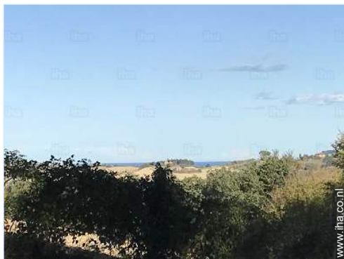
uitzicht vanuit de tuin/park