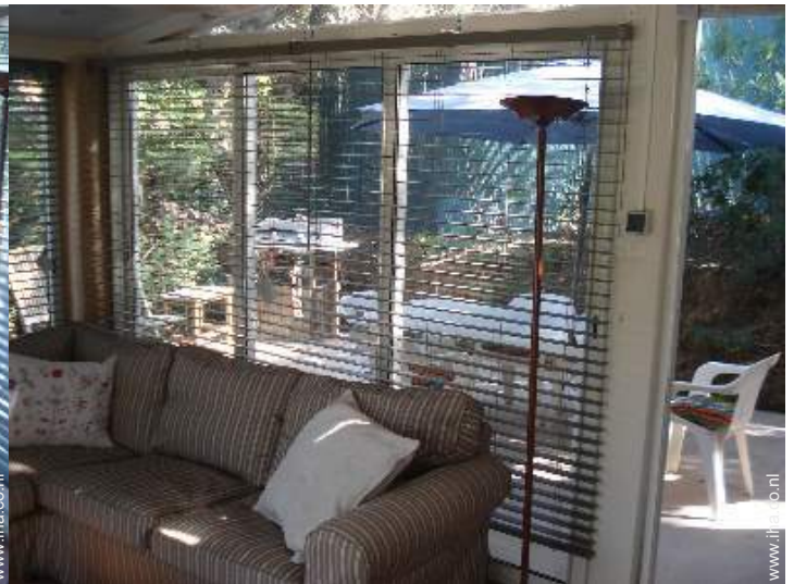
uitzicht vanaf de veranda