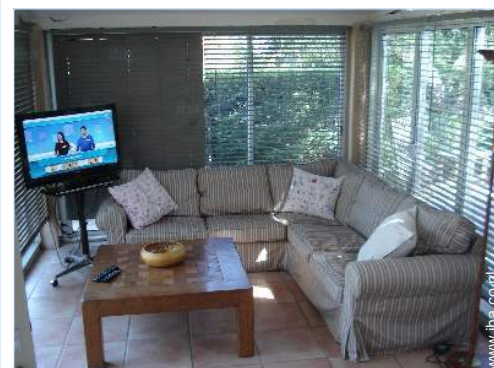
uitzicht vanaf de veranda