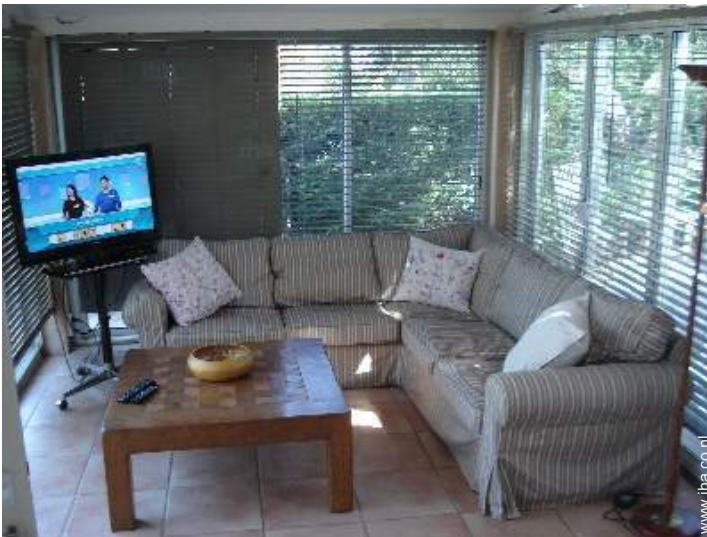
uitzicht vanaf de veranda