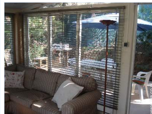
uitzicht vanaf de veranda

Supermarkt 2,5km Geldautomaat 2,5km Ziekenhuis 800m