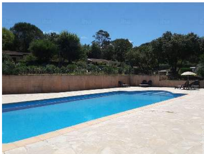
zwembad in de residentie