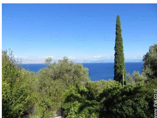
overzicht van het bezit