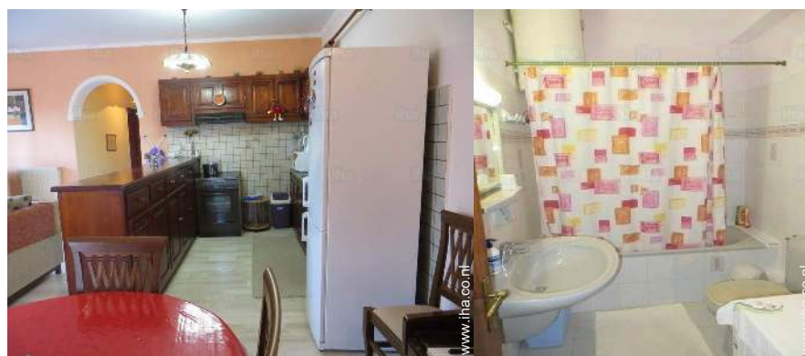
uitzicht vanuit de woonkamer