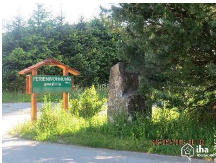
overzicht van het bezit