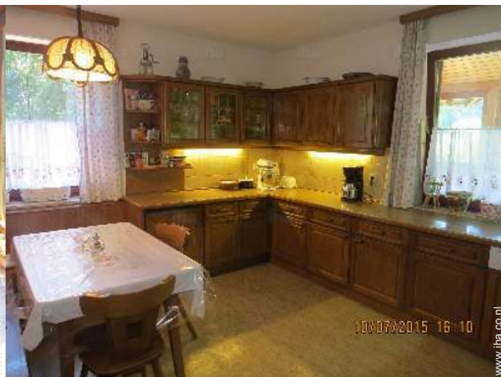
grote aparte keuken