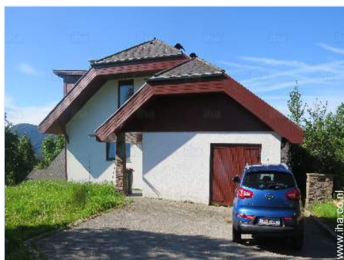
overzicht van het bezit