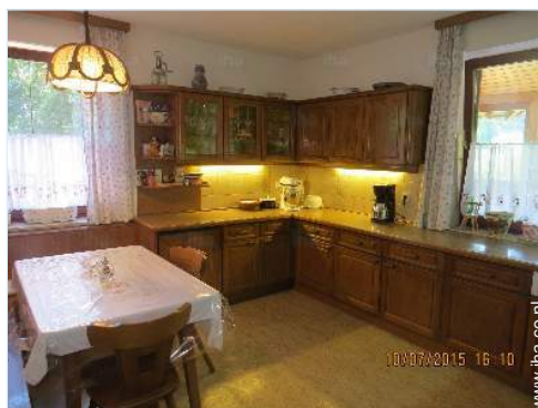
grote aparte keuken