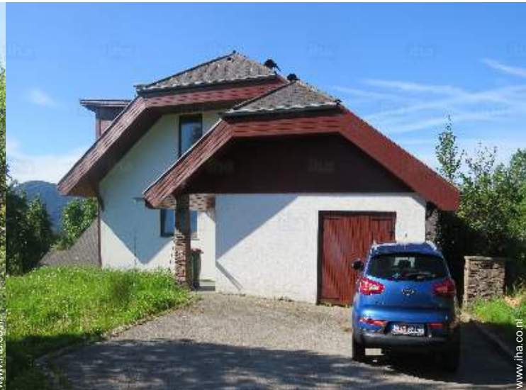
overzicht van het bezit