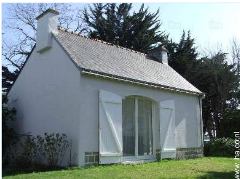
Tuin beschikbaar voor gasten

Voordelen : Directe toegang tot het strand