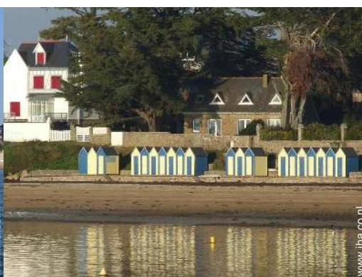
directe toegang tot het strand