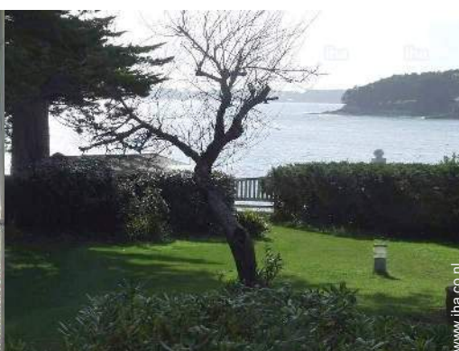
uitzicht vanuit de zitkamer