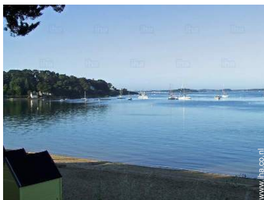
uitzicht vanuit de tuin/park