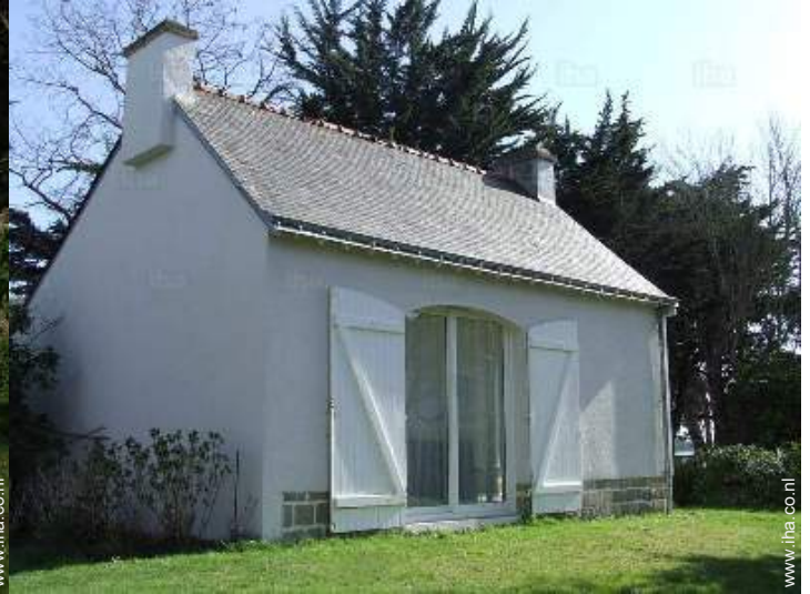
Tuin beschikbaar voor gasten