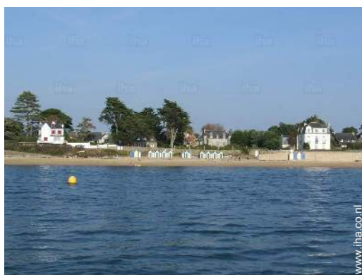
directe toegang tot het strand