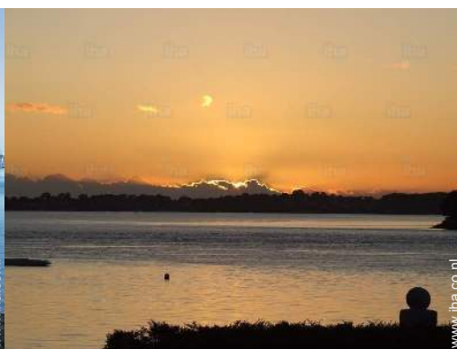
uitzicht op zonsopgang