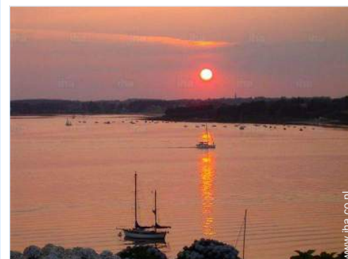
uitzicht vanuit het huis