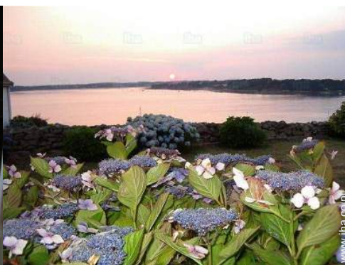
uitzicht vanuit het huis