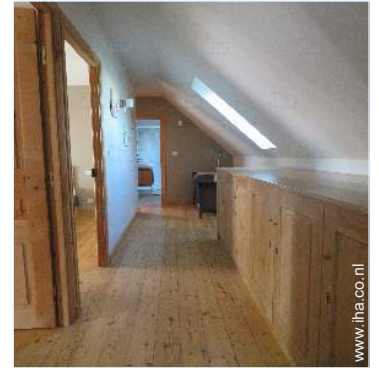
Ter beschikking staande voorzieningen

Zomerkamer, barbecue, tuintafel(s), 4 tuinstoel(en), parasol, serre, 2 ligstoel(en), 2 strandstoel(en)