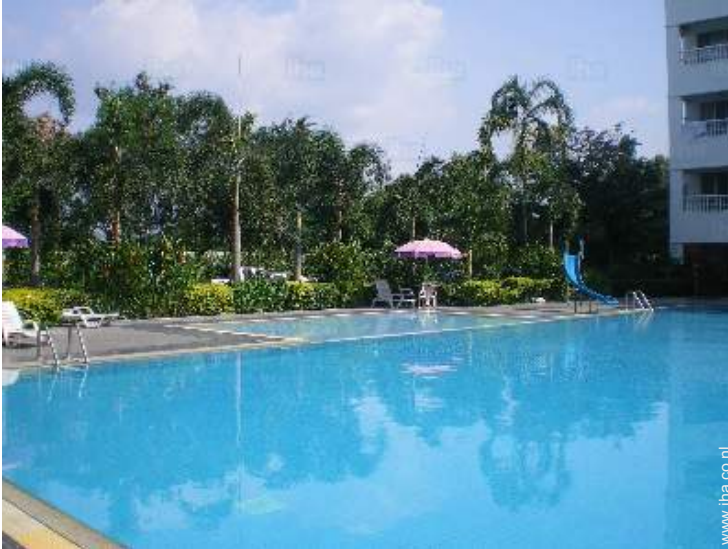
uitzicht vanuit het zwembad