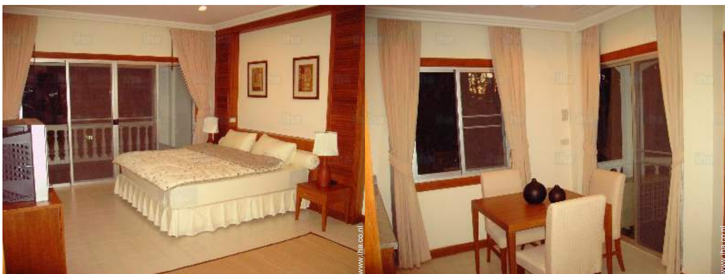
uitzicht vanuit de eetkamer