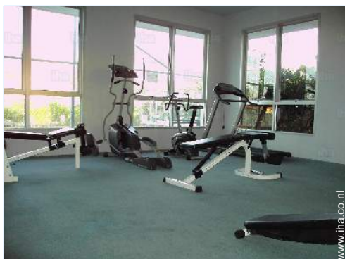
Ter beschikking staande voorzieningen