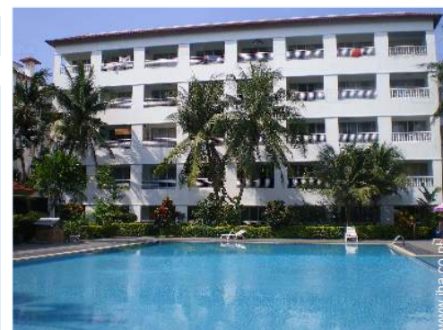
uitzicht vanuit het zwembad

Tuintafel(s), tuinstoel(en), parasol, serre