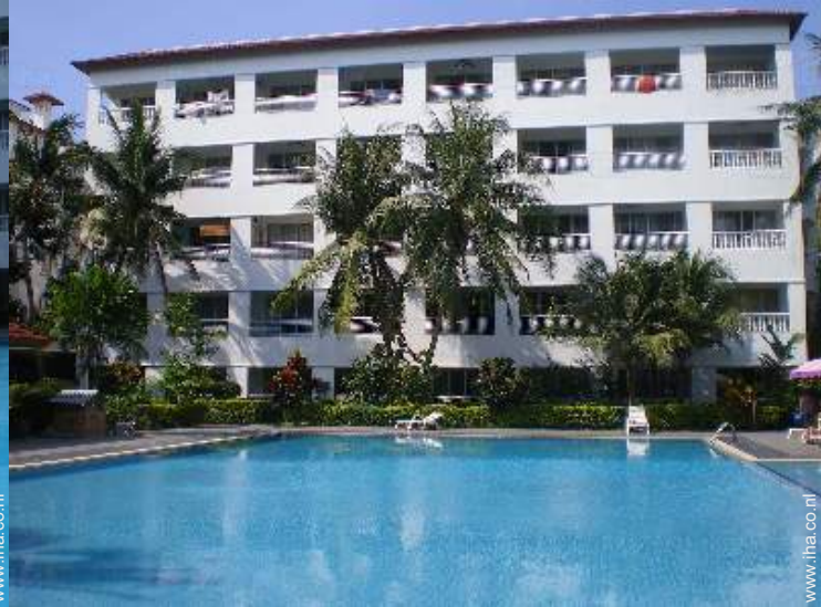
uitzicht vanuit het zwembad