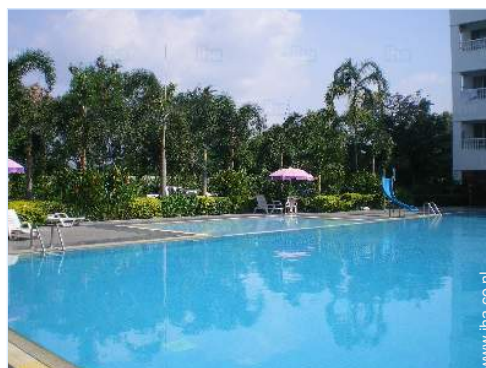
uitzicht vanuit het zwembad