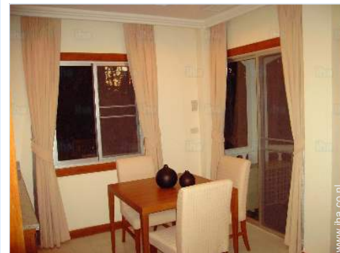
uitzicht vanuit de eetkamer