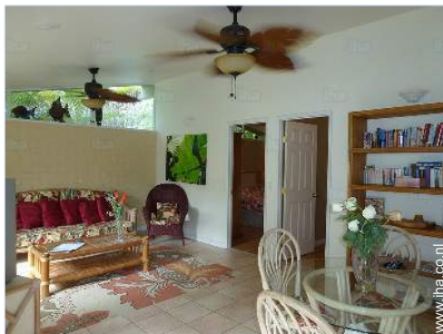
Binnenhuis inrichting en comfort

Voordelen : Directe toegang tot het strand