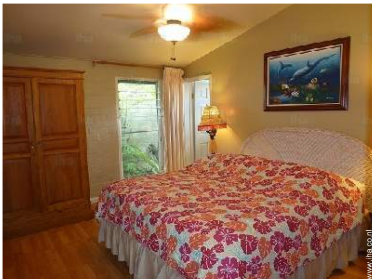
queen size bed(den)