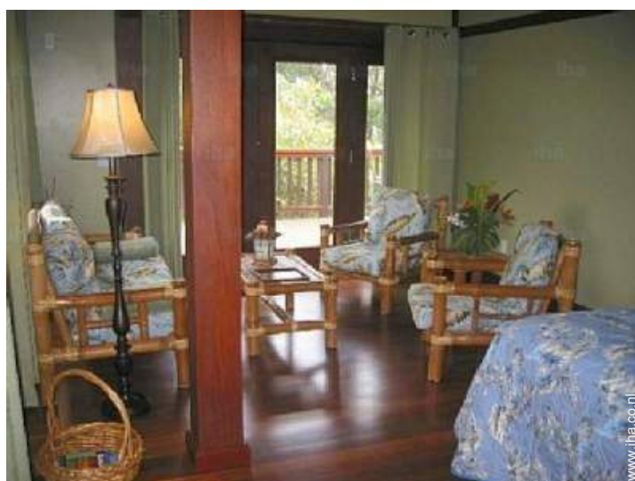
Binnenhuis inrichting en comfort