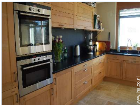
uitzicht vanuit de keuken