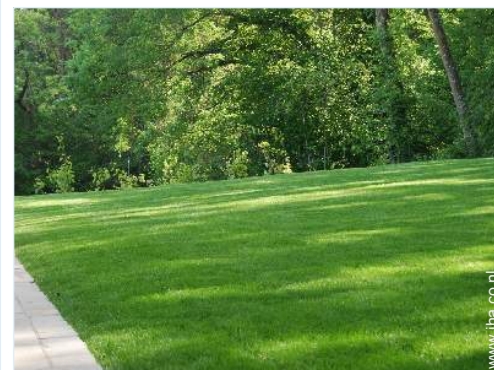
uitzicht op tuin/park

Dorpscentrum 3km Stadscentrum 5km Bushalte/busstation 500m Autoverhuur Bootverhuur 3km Verhuur van duikmateriaal Bakker 1km Traiteur Kleine winkeltjes 2,5km Supermarkt 2,5km Luxe- en merk winkels 7,5km Kapsalon 2,5km Postkantoor 800m Bank 2,5km Geldautomaat 2,5km Apotheek 2,5km Ziekenhuis 7,5km