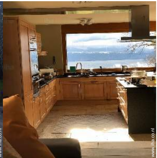
uitzicht vanuit de keuken