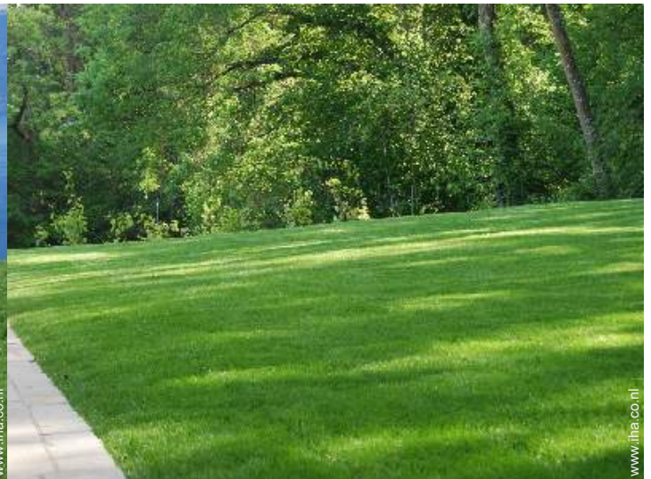
uitzicht op tuin/park