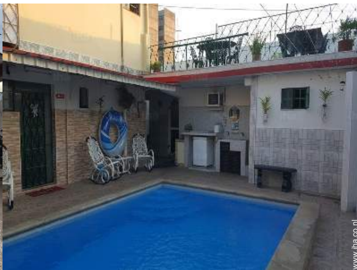
zwembad in de residentie