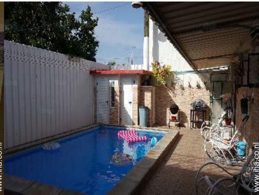
zwembad in de residentie