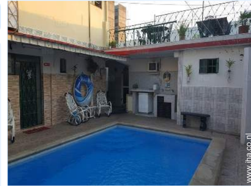
zwembad in de residentie