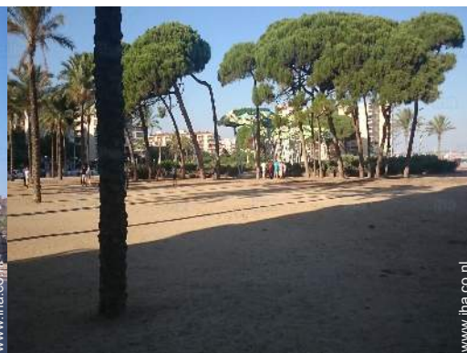
vrijetijds besteding in de nabijheid