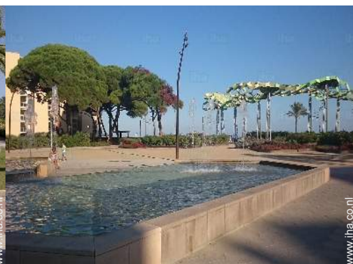
uitzicht op tuin/park