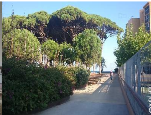
uitzicht op voetgangersgebied