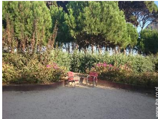
park en tuin