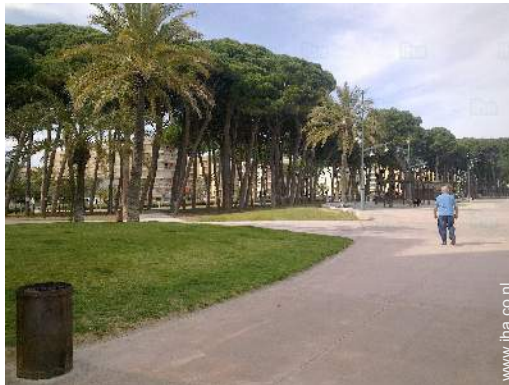
uitzicht op voetgangersgebied