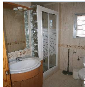
Badkamer(s) met douche

Tuintafel(s), 4 tuinstoel(en), Verplaatsbaar diensttafeltje