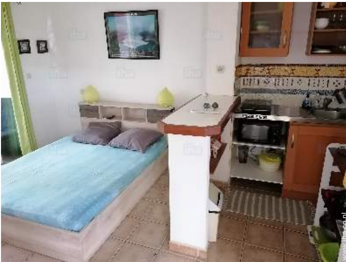
Binnenhuis inrichting en comfort