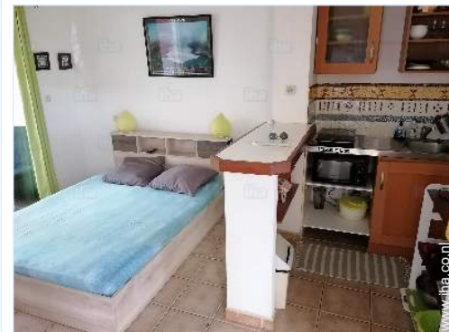
Binnenhuis inrichting en comfort