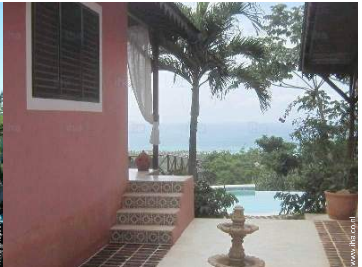
uitzicht vanuit het huis