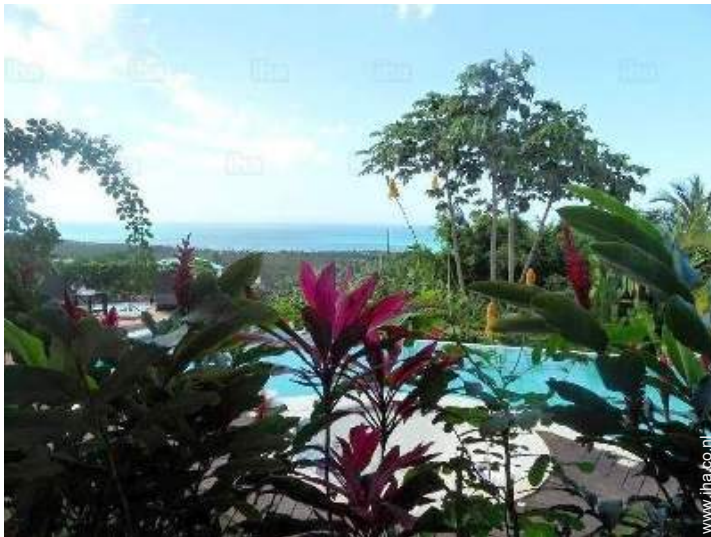
uitzicht vanuit het huis