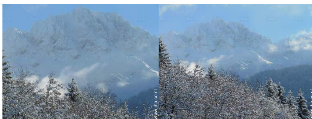
uitzicht vanuit het huis