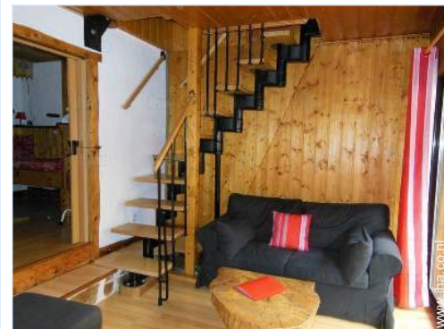
uitzicht vanuit de woonkamer