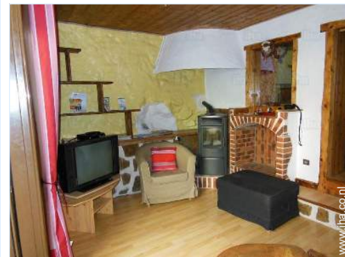
uitzicht vanuit de woonkamer