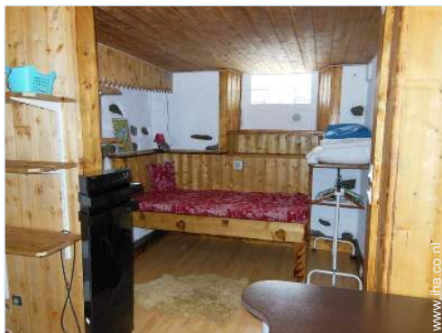
uitzicht vanuit de woonkamer