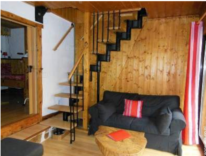
uitzicht vanuit de woonkamer