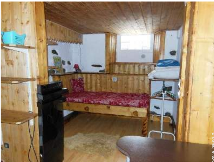
uitzicht vanuit de woonkamer