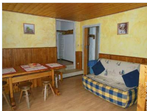
uitzicht vanaf het balkon

Vaatwerk/bestek, huishoudelijke artikelen en keukengerei, koffiekkan, koffiezetapparaat, elektrische waterkoker, broodrooster, elektrische raclette set, fondue set, gasfornuis, oven, magnetron, afzuigkap, koelkast, wasmachine, stofzuiger, strijkijzer, strijkplank