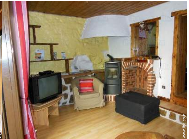
uitzicht vanuit de woonkamer