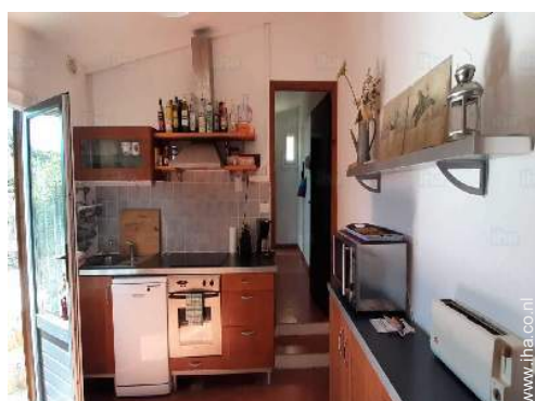
grote aparte keuken