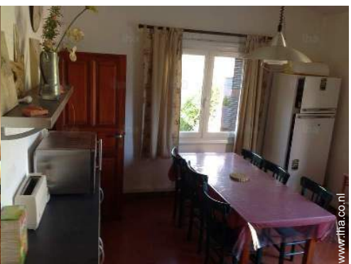
grote aparte keuken