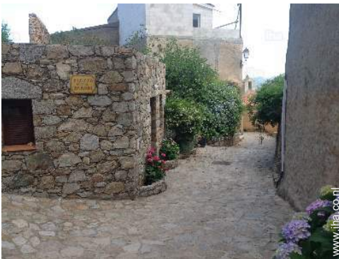
uitzicht op dorpscentrum