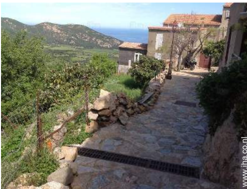
uitzicht vanuit het huis