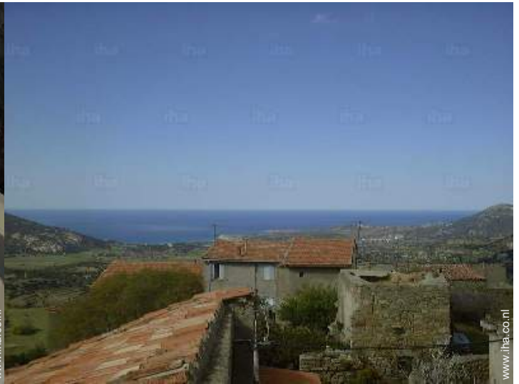
uitzicht vanuit de kamer