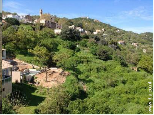
uitzicht vanuit de kamer