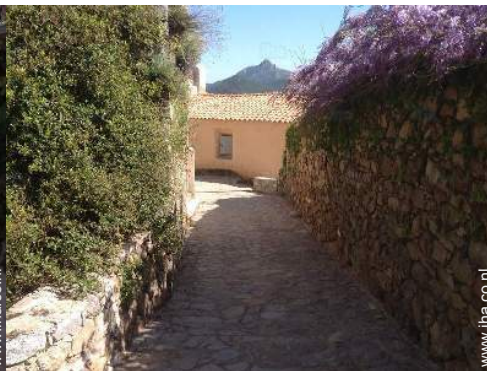
uitzicht vanuit de keuken