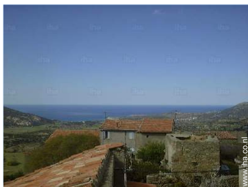
uitzicht vanuit de kamer