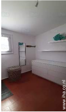
Badkamer(s) met douche