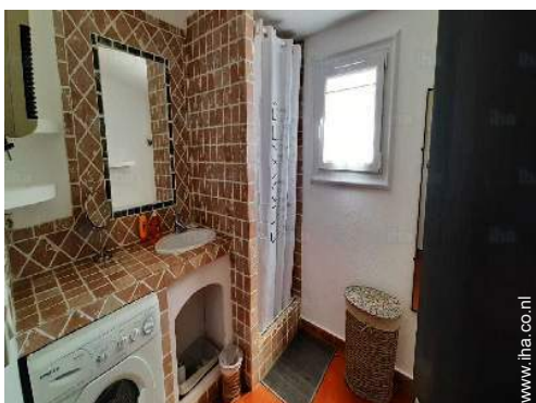
Badkamer(s) met douche