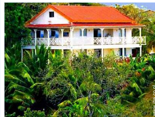
overzicht van het bezit