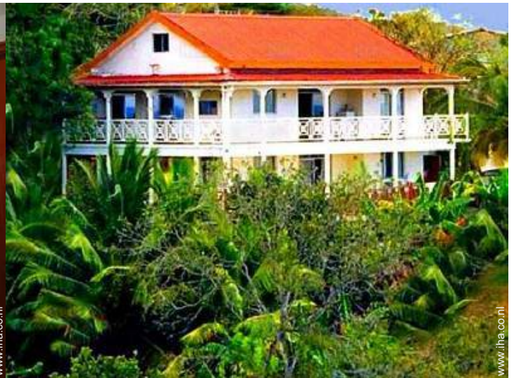
overzicht van het bezit