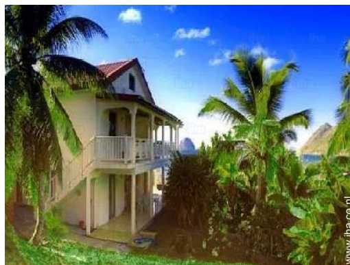
uitzicht vanuit de tuin/park