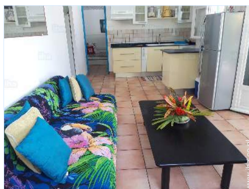
uitzicht vanuit de zitzkamer