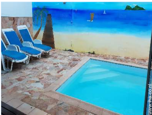
uitzicht vanuit het overdekte terras