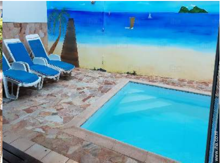
uitzicht vanuit het overdekte terras