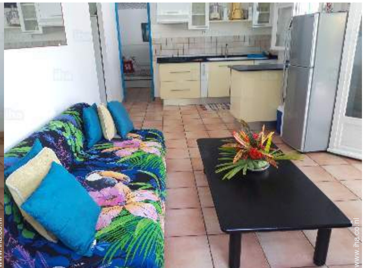
uitzicht vanuit de zitkamer