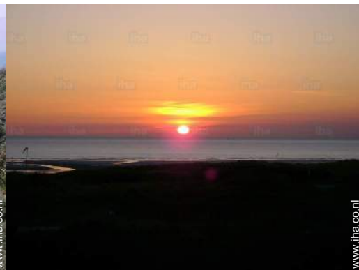
uitzicht op zonsondergang