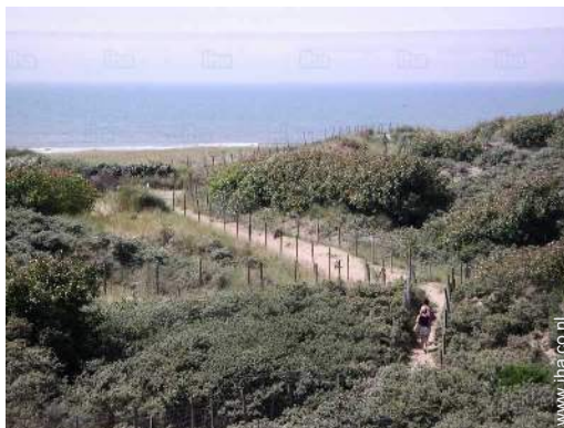
directe toegang tot het strand