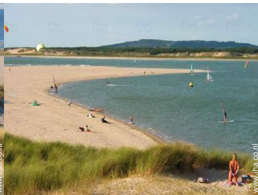
vrijetijds besteding in de nabijheid