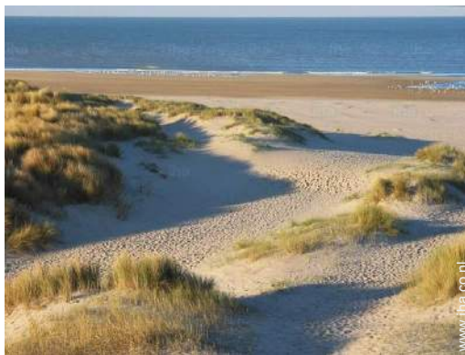
Attracties en ontspanning