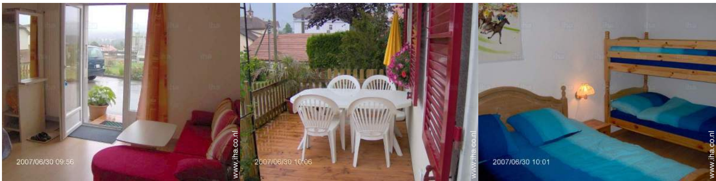
uitzicht vanuit de woonkamer