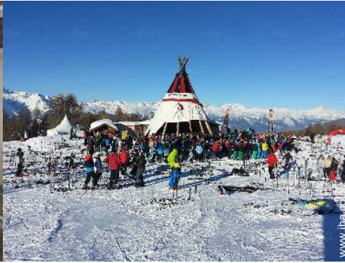
wintersportactiviteiten in de omgeving