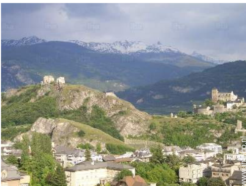
Nabij gelegen steden