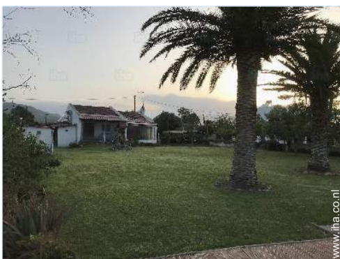
overzicht van het bezit

Voordelen : Directe toegang tot het strand