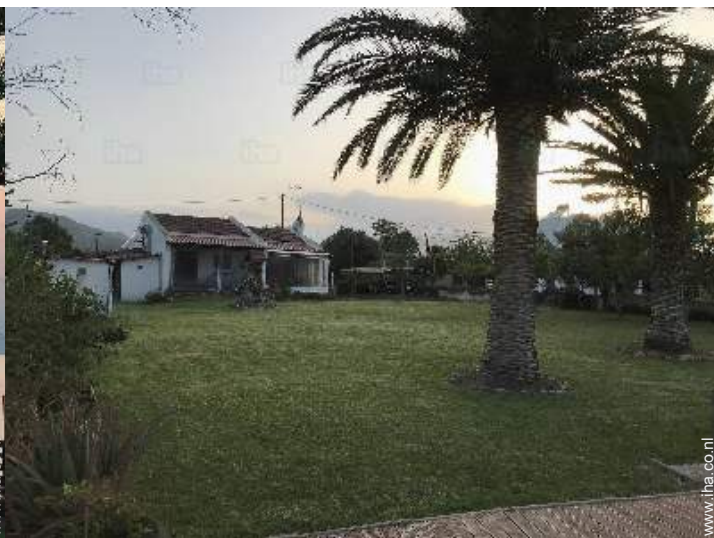
overzicht van het bezit