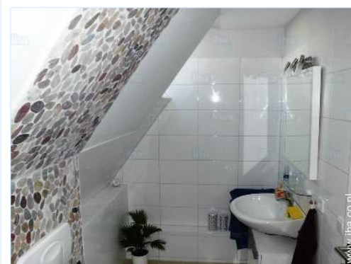
Badkamer(s) met douche