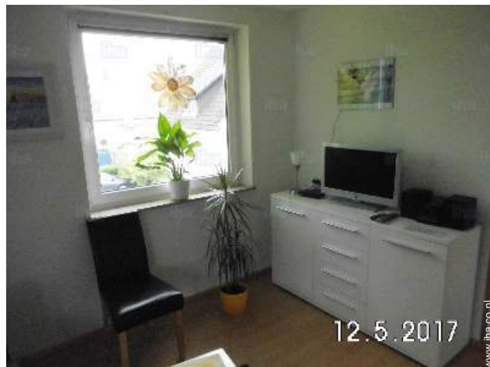
uitzicht vanuit de woonkamer