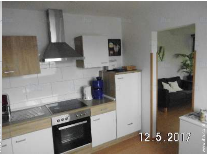
uitzicht vanuit de keuken