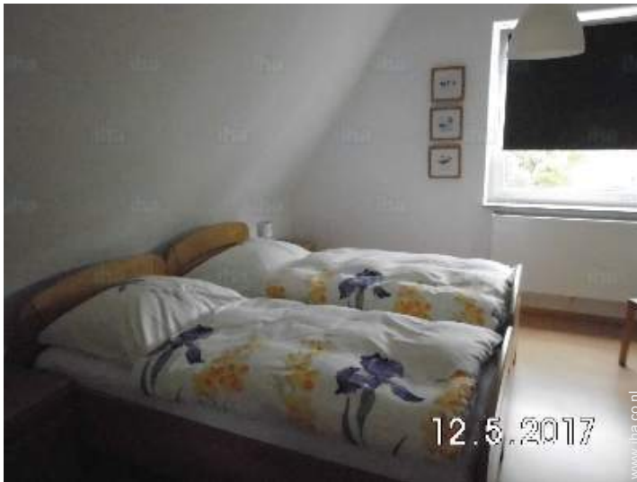
uitzicht vanuit de kamer