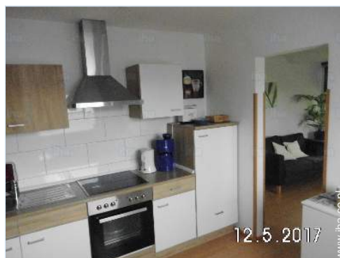
uitzicht vanuit de keuken