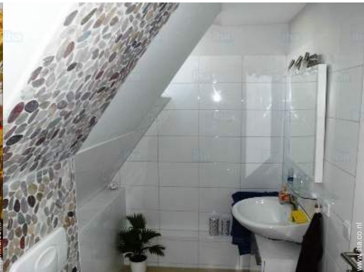
Badkamer(s) met douche